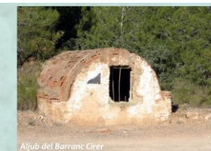
Aljub del Barranc Cirer