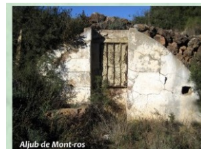
Aljub de Mont-ros