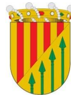
Regidoria d'Esports Ajuntament de Nàquera